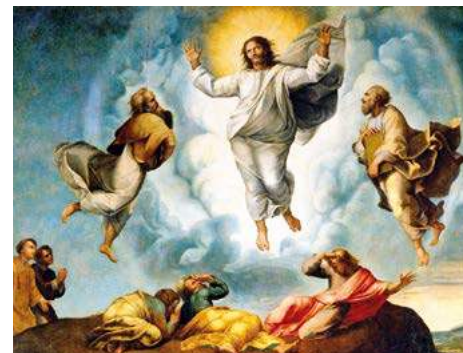
La Transfiguració (1517-1520), de Raffaello Sanzio. Pinacoteca vaticana, Ciutat del Vaticà, Roma (Itàlia)