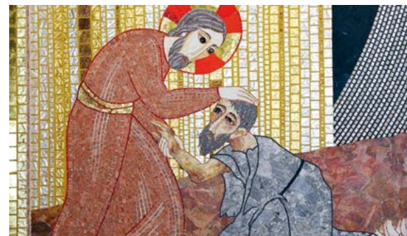
Curació del leprós (2009), de Marko Rupnik. Cripta del santuari de Sant Pius de Pietrelcina (Itàlia)