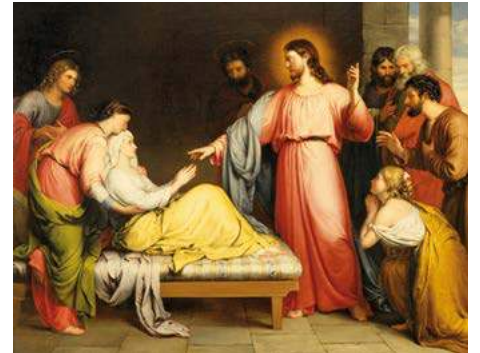
La curació de la sogra de Pere (1839), de John Bridges. Museu d'Art de Birmingham (Anglaterra)