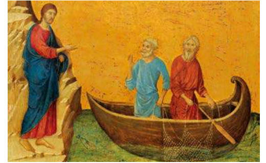
Vocació dels apòstols Pere i Andreu (1308-1311). Retaule de la Maestà de Duccio di Buoninsegna. Museu de la catedral de Siena (Itàlia)