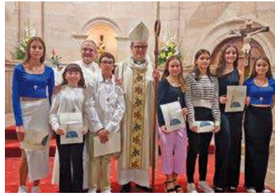
Confirmacions a Vilalba dels Arcs