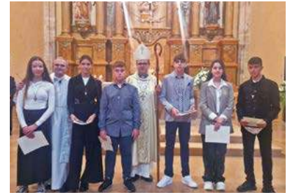
Confirmacions a Gandesa

Aquest cap de setmana, 14 i 15 d'octubre, hem tingut la visita del nostre bisbe a la Terra Alta confirmant a les parròquies de Vilalba dels Arcs i Gandesa. Durant l'homilia, el bisbe va recordar els