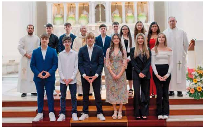
Confirmacions a la Parròquia de la Santíssima Trinitat de la Ràpita