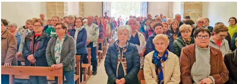
Romeria a l'Ermida de San Francisco de La Fatarella