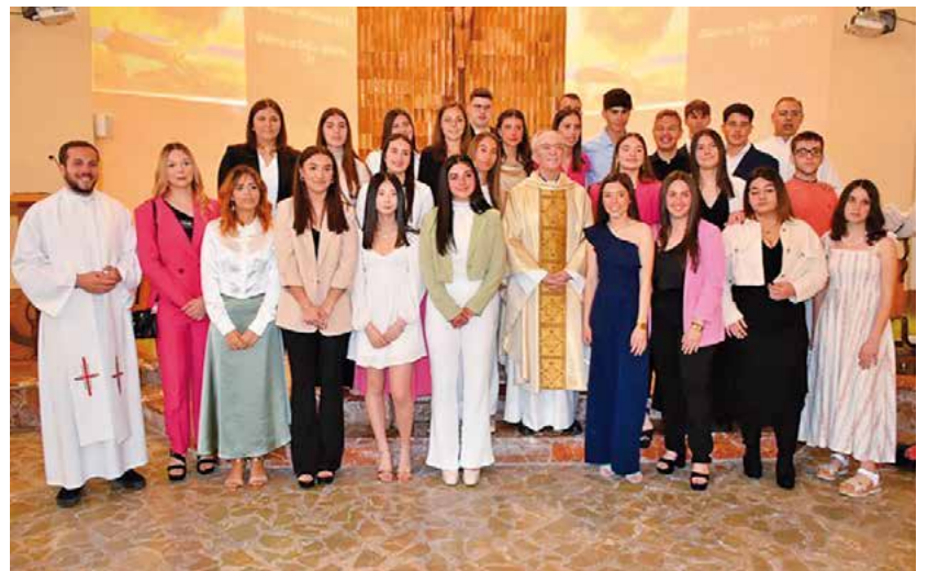
Confirmacions a la Parròquia de Sant Josep Obrer de la Ràpita