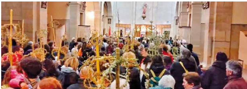
Romeria a l'Ermida de Santa Maria Magdalena de Berrús de Vilalba dels Arcs