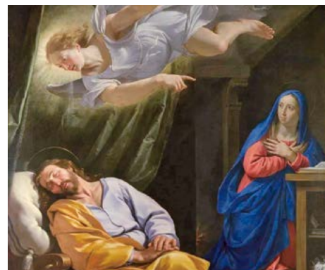
El somni de sant Josep (1643), de Philippe de Champaigne. National Gallery de Londres (Anglaterra).