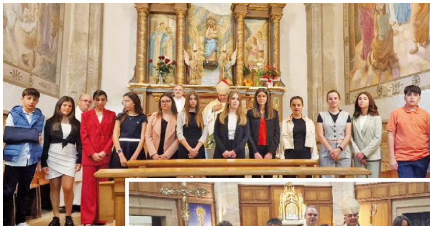
Confirmacions a Gandesa