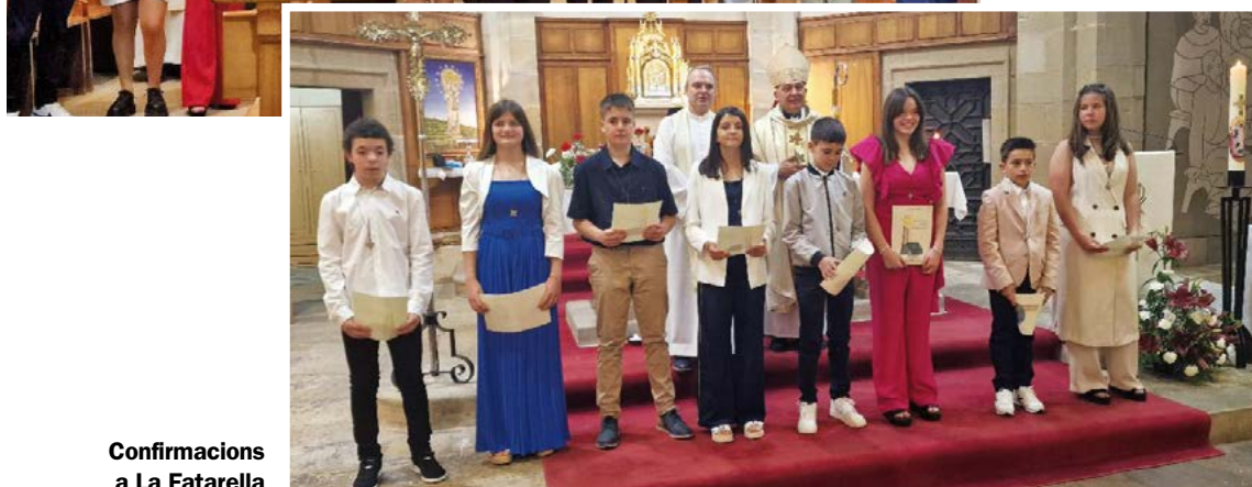
Confirmacions a La Fatarella

L es parròquies de La Fatarella i Gandesa aquest cap de setmana han estat de festa.