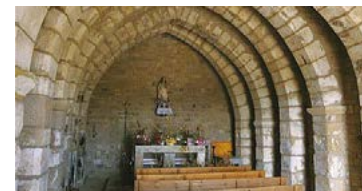
Ermita de Santa Magdalena de Berrús a Riba-roja d'Ebre