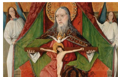
La Santíssima Trinitat (1471), Master GH. Església de la Trinitat, Mosóc (Eslovàquia)

«Déu, donant-nos l'Esperit Sant, ha vessat en els nostres cors el seu amor»