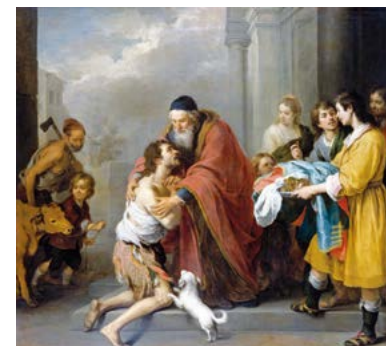
El retorn del fill pròdig (1667-1670) de Bartolomé Murillo. Galeria Nacional d'Art, Washington DC (EUA)