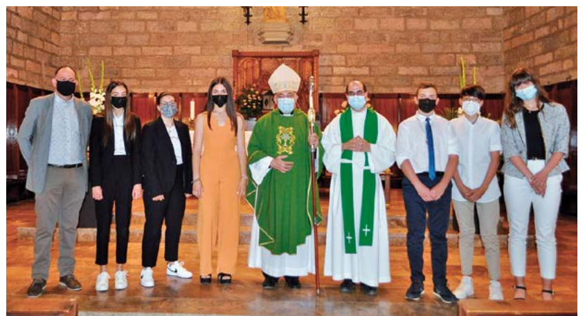
Confirmacions a Tivissa

E l passat dia 13 de juny, tres joves de la comunitat parroquial del Masroig i sis de Tivissa van rebre el sagrament de la Confirmació de mans del nostre Sr. Bisbe.