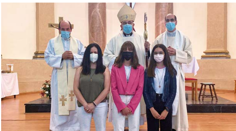
Confirmacions al Masroig