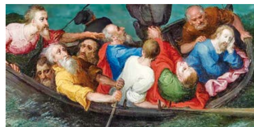
Crist en la tempesta del mar de Galilea (1590), de Jan Brueghel el Vell. Museu Thyssen-Bornemisza, Madrid (Espanya)

La paraula de Déu ens convida avui a l'admiració i a la confiança en Déu. A l'evangeli veiem com es calma la mar només amb la paraula de Jesús: Calla i estigues quieta. El vent amainà i seguí una gran bonança. Abans havia subratllat la situació dramàtica que vivien els apòstols: S'aixecà un temporal de vent tan fort que les onades queien sobre la barca i s'anava omplint. Hi ha moments que sembla que a Déu no li importen els nostres problemes (llavors i ara): No veieu que ens enfonsem? Però Jesús és senyor de la creació i amb una paraula la pot dominar. Ell no és mai lluny de nosaltres tot i que sembli que dorm: Era a popa dormint amb el cap reclinat. El poder de Jesús sobre la creació ha d'inspirar, també als deixebles, no solament respecte i estupor sinó sobretot amor i molta confiança: Per què sou tan porucs? Encara no teniu fe? La fe del deixeble ha de ser prou madura com per infondre pau i serenitat fins i tot en els moments que sembla que Déu guarda silenci o permet la tempesta.