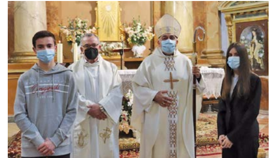
Confirmacions a Sorita