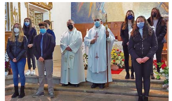
Confirmacions a Castellfort

Per als pobles petits com Castellfort i Sorita és especial la visita del Sr. Bisbe per administrar el sagrament de la Confirmació. I així va ser el diumenge 25 d'abril.