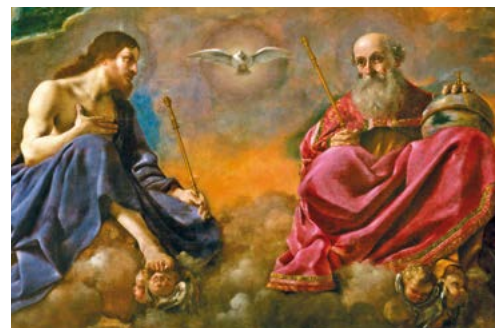
La Santíssima Trinitat (1616-1617) de Giovanni Francesco Barbieri (Il Guercino). Palau Magnani, Bolonya (Itàlia)