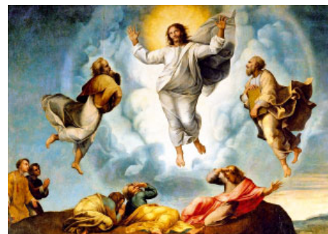
La Transfiguració (1517-1520), de Raffaello Sanzio. Pinacoteca vaticana, Ciutat del Vaticà, Roma (Itàlia)

S ovint les aparences amaguen l'autèntica realitat. Ho veiem tant a la primera lectura com a l'Evangeli.