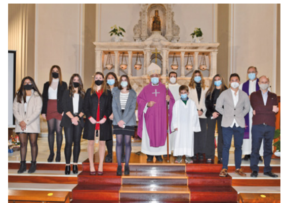
Confirmacions a la parròquia Santíssima Trinitat