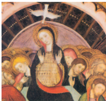
La vinguda de l'Esperit Sant sobre Maria i els Apòstols. Obra de Jaume Serra. MNAC, Barcelona

»La paz os dejo, mi paz os doy; no os la doy yo como la da el mundo. Que no tiemble vuestro corazón ni se acobarde. Me habéis oído decir: «Me voy y vuelvo a vuestro lado». Si me amarais, os alegraríais de que vaya al Padre, porque el Padre es más que yo. Os lo he dicho ahora, antes de que suceda, para que cuando suceda sigáis creyendo.»